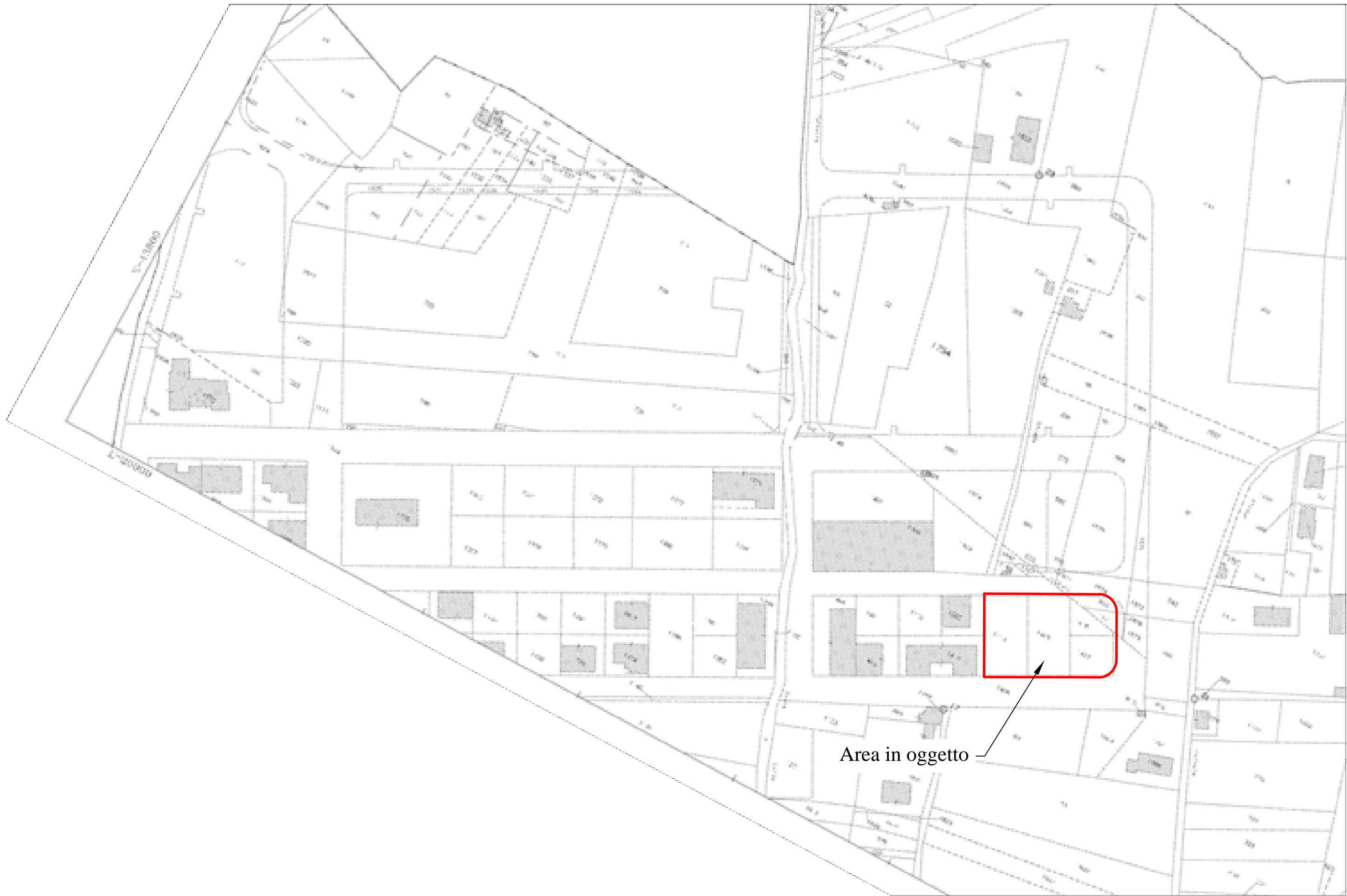
Stralcio foglio catastale n. 7, particelle 832, 1171, 1414, 1415, 1416 e 1417